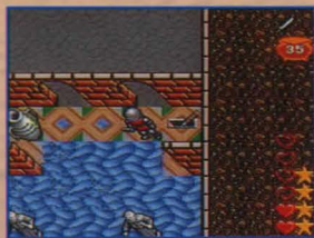
進めそうで進めない…？

イエローアローで壁を通り抜けると、コウモリが舞う部屋に出ます。ここからは、敵を倒しなから（あるいは敵の攻撃を避けて）進んでください。大きなキノコを触ると地震が起こり次の部屋に行けます。この部屋は少しむずかしいけど、敵の攻撃はないので、しばらく自分で考えてみましょう。