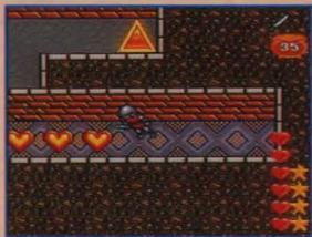
歩くたびにハートが

いよいよ最終ステージです。三角のゾーン（イエローアロ）を踏むと壁を通り抜けて、クライマックスの舞台へ入っていきます。しかし、その前に体力を回復しておきましょう。三角のゾーンの方に行く前に、反対側に進んでください。綺麗な床が現われ、そこを歩くとハートが出てきます。遠慮なく拾い集めましょう。