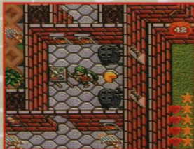
タンス、ツボなどを動かすと、アイテムが出現することがあります。

アイテムの上を通過すれば、そのアイテムを入手できます。ショップでアイテムを購入する場合も、アイテムの上を通過してください。そばにある看板の数字がそのアイテムの値段です。自動的に所持金から、アイテムの代金が引かれ、ステータス画面にアイテムが表示されます。所持金が足りない場合は、アイテムの上を通過しても手にいれることはできません。